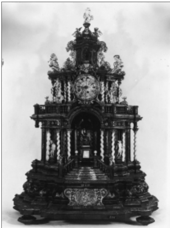
Tempelformet ur med ornamenten i skildpadde, sølv og elfenben. Udført i Augsburg o. 1710 og købt af Frederik 4. i 1716.

dannelse. Hans reformer var et forsøg på at forbedre samfundet og mennesket i samfundet. Struensees forsøg slog fejl, fordi han overtrådte regler, der var grundlæggende for det enevældige styre (han skrev bl.a. under i kongens sted), og fordi tiden ikke var moden til en mere frisindet indstilling til tilværelsen.