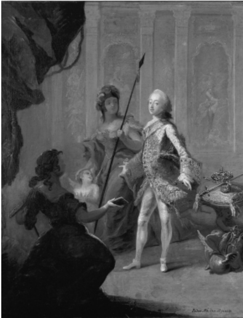
Frederik 5., ved hans side Minerva, visdommens gudinde. Foran knæler malerkunsten i en kvindes skikkelse. Allegorisk fremstilling. Peder Als.

sterende slotte. Han renoverede Københavns Slot, ændrede på interiører på Rosenborg (Riddersalens stukloft) og Frederiksborg Slot, hvor han også lod anlægge et imponerende haveanlæg, der trak en lige linie fra kongens soveværelse ned gennem havens terrasser for at ende i en stor sø, som reflekterede himlen; et symbol på den enevældige kongemagt.