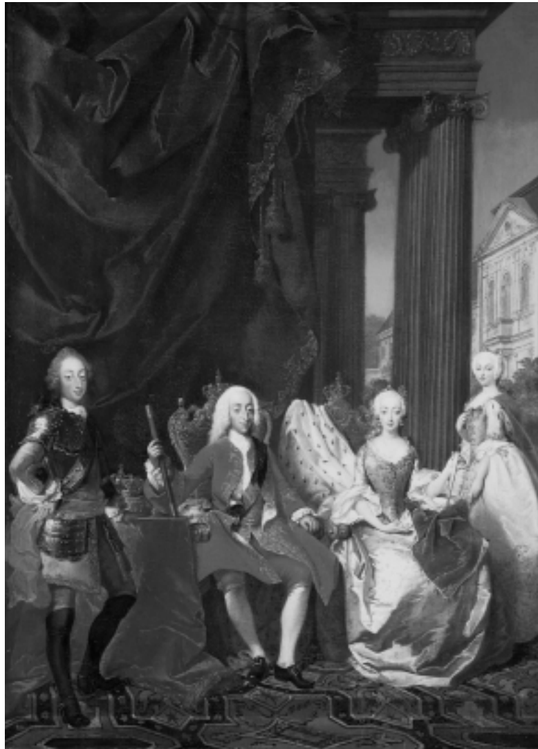
Christian 6. og dronning Sophie Magdalene og kronprinseparret Frederik(5.) og Louise. Maleriets draperier og søjler signalerer magt og maskulinitet, mens haveudsigten bag kvinderne peger mod hjemmets og naturens fred. Det intime familiebillede menneskeliggør kongefamilien og foregriber den oplyste enevældes tanker om fyrsten som folkets første tjener. M Tuscher o. 1744.

det gjorde dem ikke til mindre troende. I første halvdel af 1700-tallet var pietismen den stærkeste åndelige bevægelse i Danmark. Pietismen lagde vægt på et personligt, følelsesbetonet og direkte forhold til Gud og vendte sig mod dogmatiske trosforestillinger. Frederik 4. blev på sine gamle dage grebet af pietismen, og sønnen Christian 6.'s regeringstid prægedes af hans stærke pietistiske tro. Ludvig Holberg stod derimod som garant for tanker, der var inspireret af franske oplysningsfilosoffer, og han havde en stor indflydelse på tidens unge intellektuelle. Det kom til konfrontationer mellem disse retninger, men konfrontationerne holdt sig på det litterære plan. Tidens tolerance-fordringer prægede alle. Da Holberg i 1741 fik udgivet »Niels Klims underjordiske Rejse«,