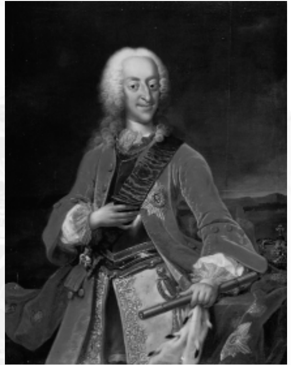
Christian 6. i rød fløjskjole og brystharnisk. (1699-1730-1746). J. S. Wahl