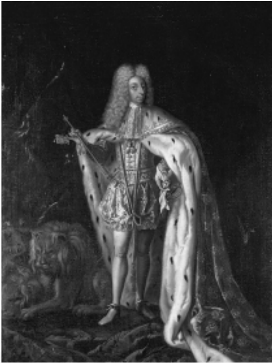
Frederik 4. i salvingsdragt. (1671-1699-1730).