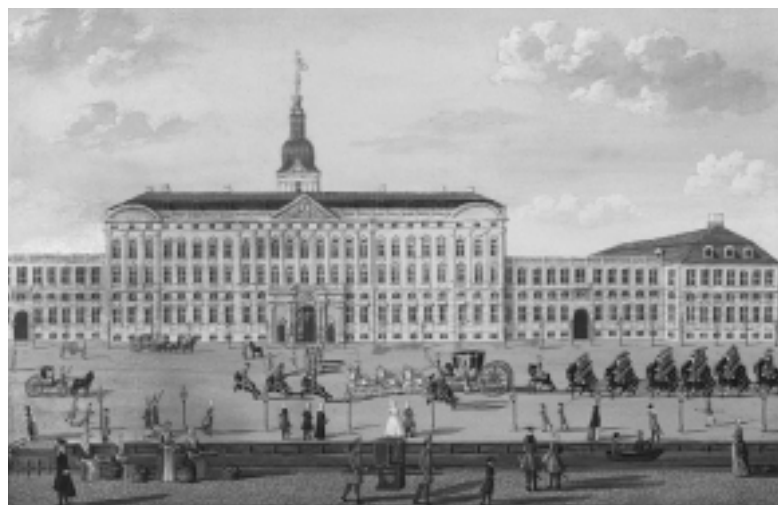
Christiansborg Slot på Christian 6.s tid.

Frederik 4. byggede Frederiksborg Slot på et område, der tilhørte hans mor Charlotte Amalie og Fredensborg Slot til minde om freden i 1720, samt den røde kancellibygning, i dag Finansministeriet, ved siden af Københavns Slot. Desuden udførtes udbedringer på de allerede eksisterende