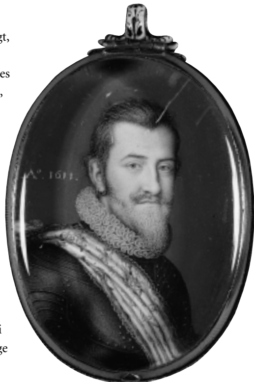
Portræt af Christian 4. 1611. Jacob van Doordt/ Isaac Oliver.

Rosenborg-samlingen er kongehusets ejendom og skal gå i arv fra konge til konge, dog under statens vedligeholdelse og kontrol. Af samme grund vogter Den kongelige Livgarde slottet og dets skatte døgnet rundt. Den kongelige Livgardes kaserne flyttede ind i Christian 4.'s Orangeri i 1742, hvor de har holdt til lige siden.