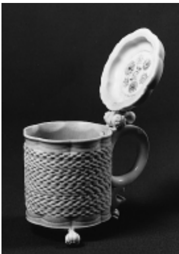
Lågekande af elfenben- formentlig drejet af Christian 4. omkring 1660. Fra midten af 1500-tallet blev kongerne og deres sønner undervist i kunsten at dreje på drejebænk. Det blev betragtet som tidsfordriv i et ellers strengt opdragelsesprogram.