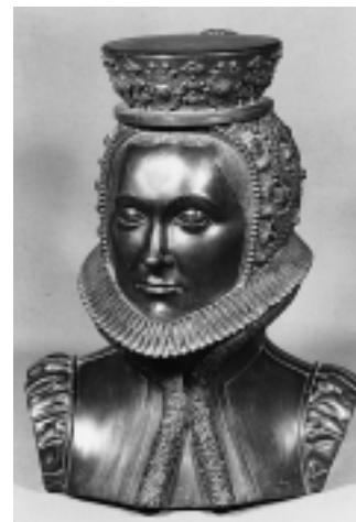
Buste af dronning Sophie, pendant til buste af Frederik 2.

mens kongen endnu levede. Christian 4. blev derfor valgt til tronfølger over Danmark og Norge i en alder af 3 år.