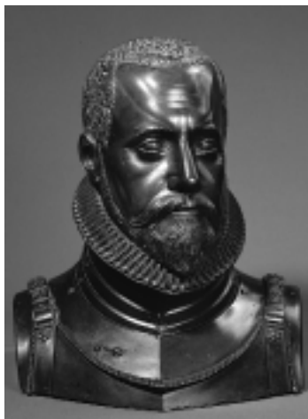
Buste af Frederik 2., af Johann Gregor van der Schardt.