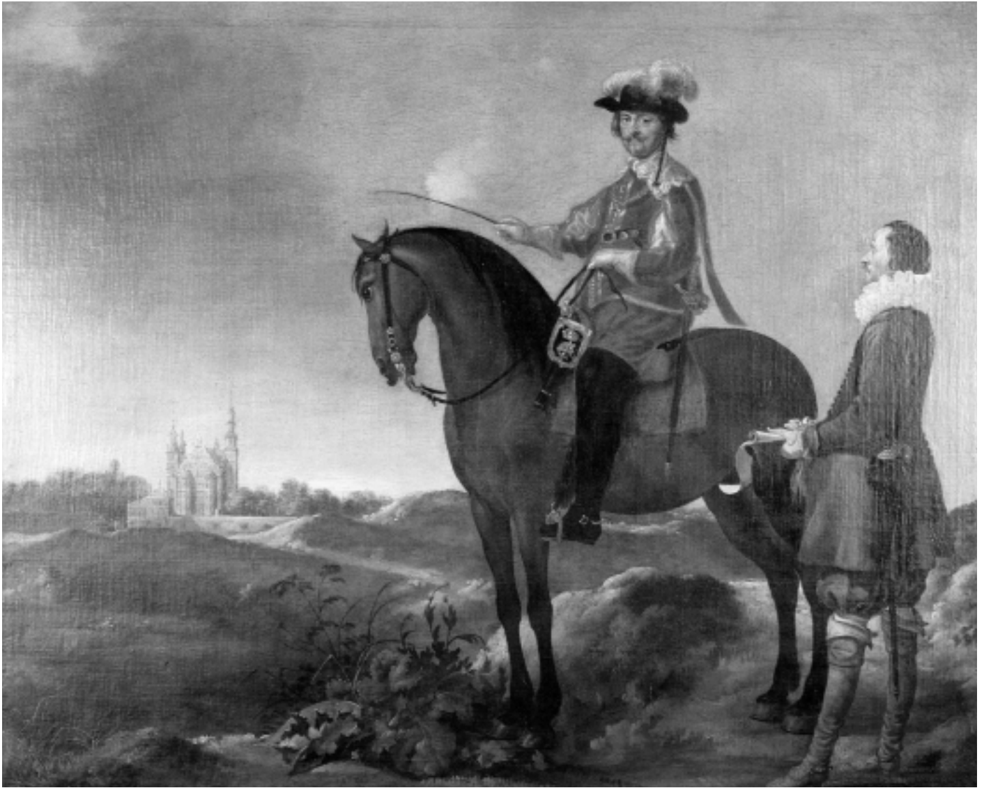
Portræt af Christian 4. i samtale med ingeniør; i baggrunden landskab med Rosenborg Slot og portbygning.

trods sit lille omfang hurtigt et af kongens foretrukne opholdssteder, når han besøgte hovedstaden. Det lille lystslot var et intimt opholdssted, hvor kongen kunne samle sine venner til en fortrolig samtale. Slottets nuværende navn er netop opstået på denne baggrund, da kongen samlede sine nærmeste til fortrolige samtaler under den forgyldte rose i en af slottets sale. Rosen var dengang tavshedens symbol, deraf navnet Rosenborg, – stedet, hvor man kunne tale i fortrolighed med kongen.